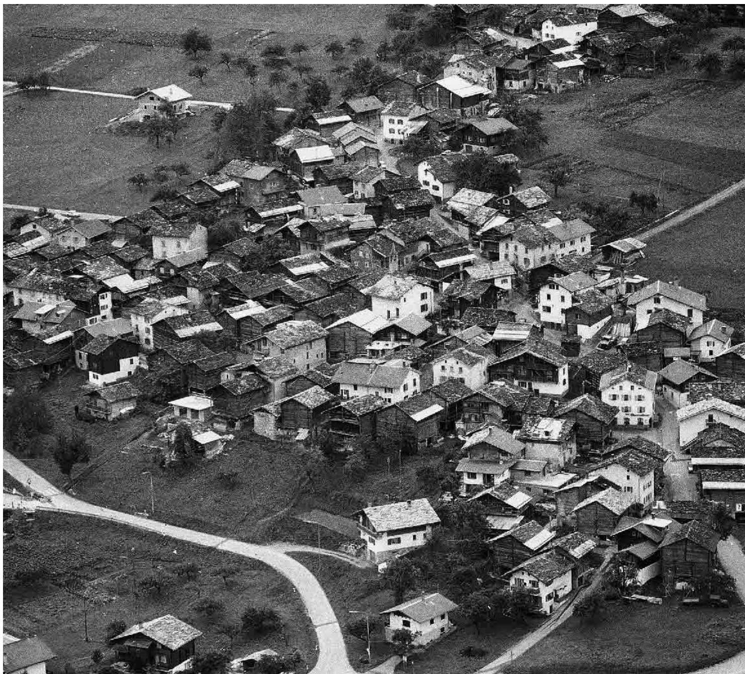
Photo aérienne Charles-André Meyer 1985, © SAT, Canton du Valais, Sion

Implanté sur un cône alluvionnaire intermédiaire du versant qui lui confère sa structure en éventail, le site recèle des dépendances en maçonnerie du 16 e -17 e siècle, très typiques, qui tranchent sur les constructions en madriers. Son tissu dense se traduit par des silhouettes compactes.