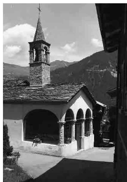
3 Chapelle Saint-Michel, 18 e s.