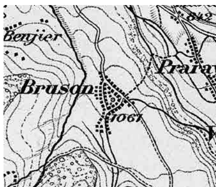
Carte Siegfried 1878

Implanté sur un cône alluvionnaire intermédiaire du versant qui lui confère sa structure en éventail, le site recèle des dépendances en maçonnerie du 16 e -17 e siècle, très typiques, qui tranchent sur les constructions en madriers. Son tissu dense se traduit par des silhouettes compactes.